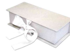
Im exklusivem Geschenketui